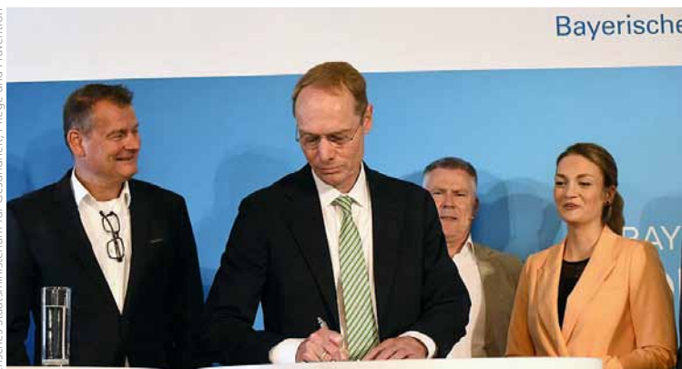
Oliver Kirst, BPI-Vorsitzender, unterzeichnete die Gemeinsame Erklärung des Bayerischen Pharmagipfels 2024.

Impressionen der Veranstaltung können Sie unter dem Link rechts oben im Kurzfilm der Bayerischen Staatsregierung Revue passieren lassen. LP